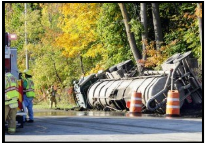
Las personas de emergencia responder a un accidente de una caída de un tanque de estiércol en la carretera.

Póngase en contacto con Extensión UW de su condado para obtener más recursos en Inglés y Español sobre la Entrenamiento para Trabajadores de Granjas Lecheras : www.yourcountyextensionoffice.com